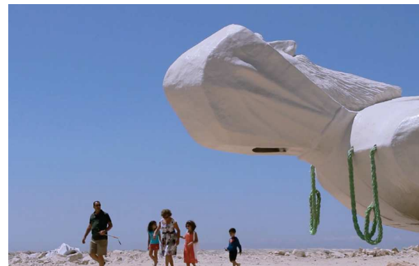
Bassem Saad, Saint-rise: I Am a Grain of Wheat , vidéo HD, couleur, son, 14', 2018